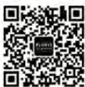
PENNY'S班尼食物研究所 微信公众号: PennysStudio