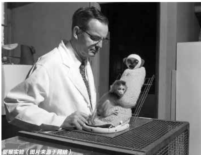
婴猴实验

当孩子哭的时候，如果父母能马上出现并询问小朋友的需求，就容易发展出安全的依恋关系。因为孩子知道当他有需求时，外界可以给他一个敏感