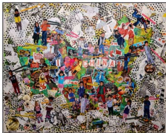
Teamwork_Rose Class_EC_The Map of China