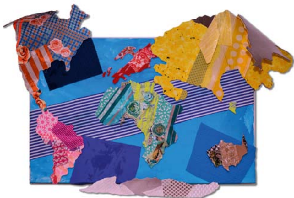
Teamwork_White Class_EC_Oh! The Places You'll Go Part1

Artworks from Montessori School of Shanghai