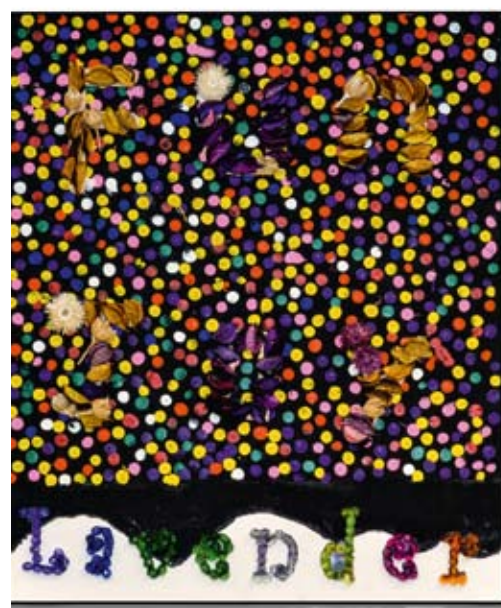
Teamwork_Lavender Class_EC_Fun and Joy