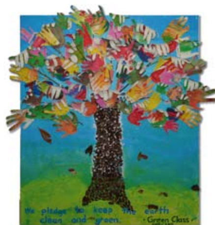
Teamwork_Green Class_EC_Tree of Hope