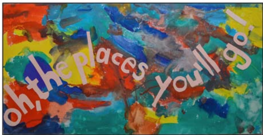
Teamwork_White Class_EC_Oh! The Places You'll Go Part2