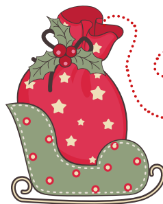
姐姐用零花钱送给弟弟的节日礼物