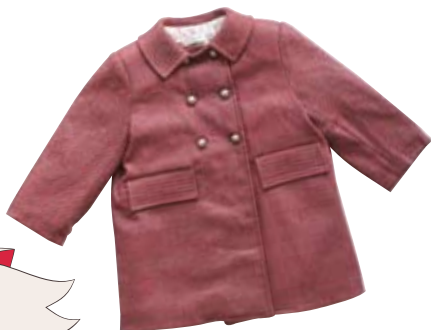
单品推荐： Gusella 女童羊毛大衣