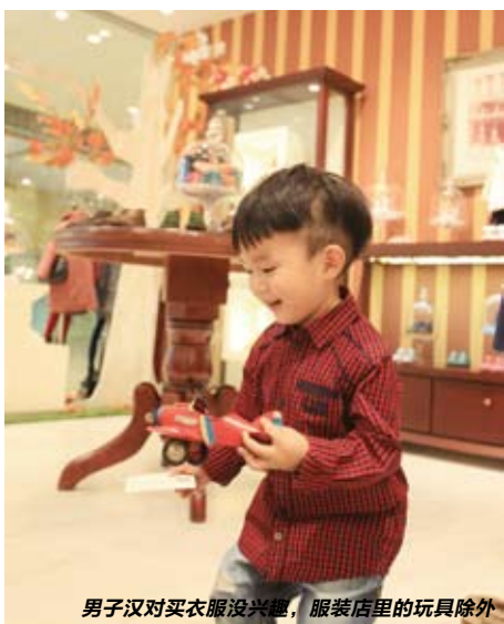
男子汉对买衣服没兴趣，服装店里的玩具除外