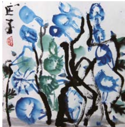
庄子-7岁-《水墨牵牛花》