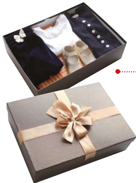
弟弟用零花钱送过姐姐的节日礼物