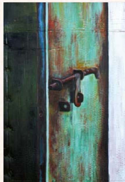
Aiwen Shao - Solitude Series (Rust) 2012