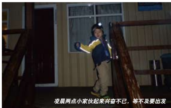
凌晨两点小家伙起来兴奋不已，等不及要出发