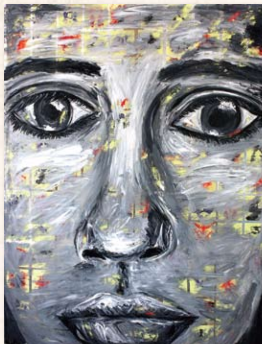
Gemma Duffy - Erasing Yourself 2012