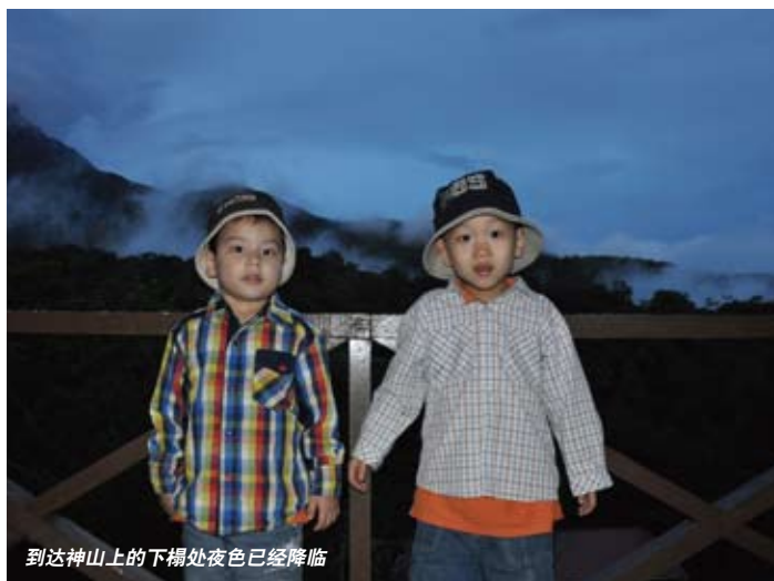
到达神山上的下榻处夜色已经降临