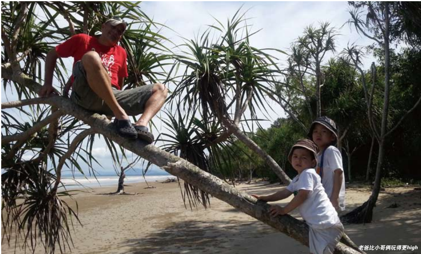
老爸比小哥俩玩得更high