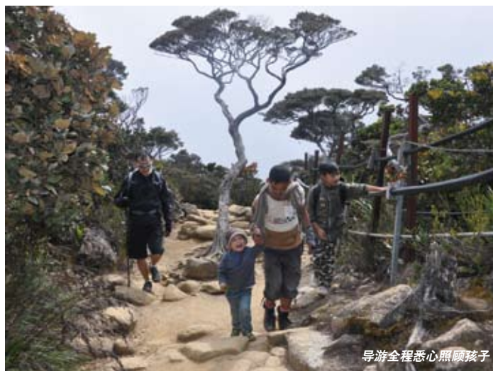
导游全程悉心照顾孩子