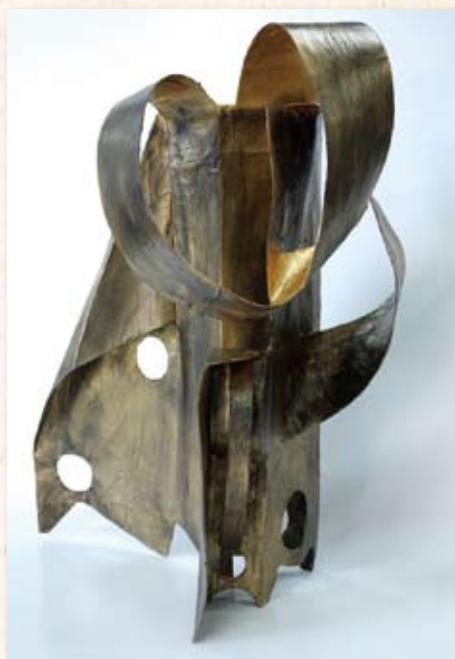
Yasmin McDowell - Flow III 2012