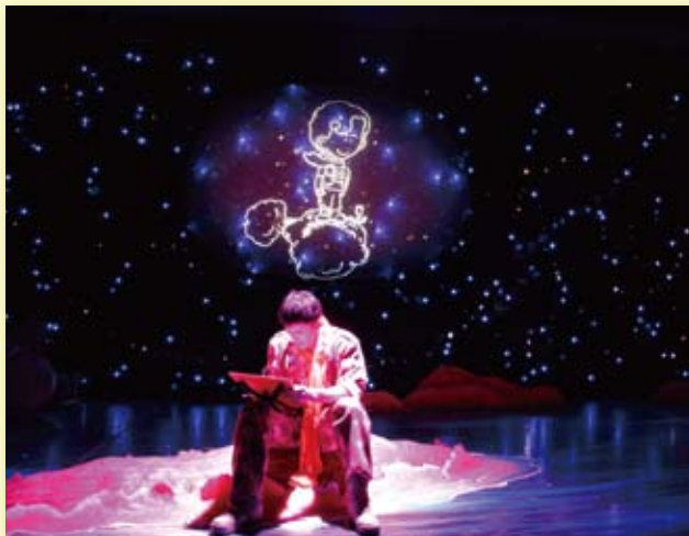
中国儿童艺术剧院《小王子》