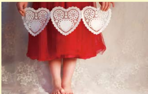
嘉里大酒店母亲节活动