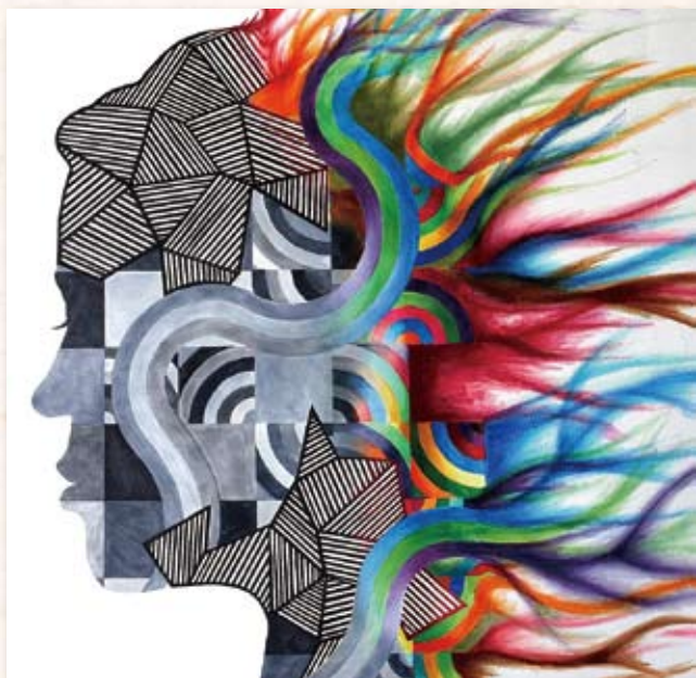
Jacqueline Hsiao - Internal Chaos 2012