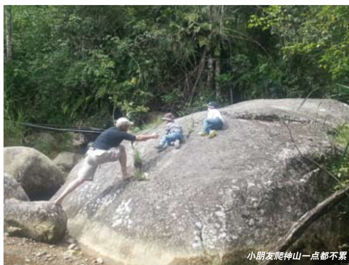
小朋友爬神山一点都不累