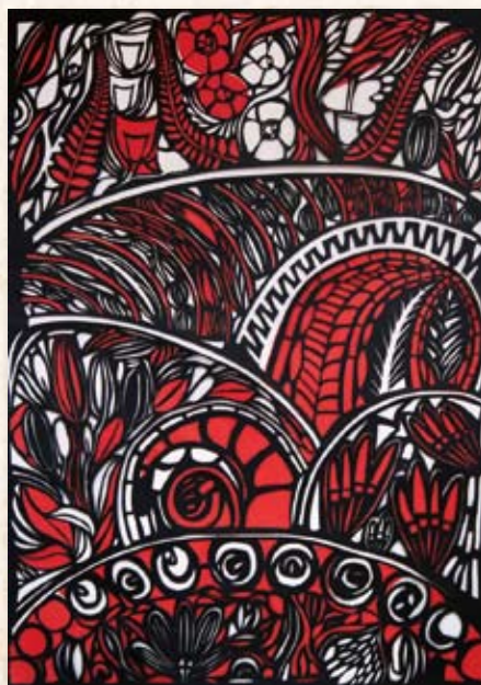
Grace Luo - Reminiscence 2013