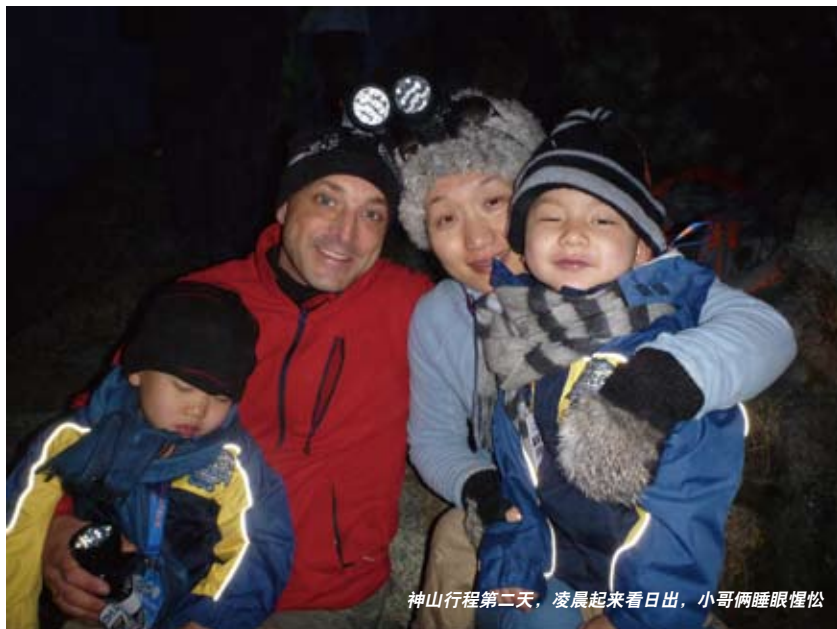
神山行程第二天，凌晨起来看日出，小哥俩睡眼惺忪

在吉隆坡打车，很可能碰上需要与司机谈价钱而不打表的情况。司机一般开价都还公道，根据国内其他旅行者的经验分享，按7-8折议价即可。马来西亚有好几家电信服务商，许多国人都推荐下飞机后在机场购买DIGI卡（为iPhone用户提供剪卡服务）。它的通话资费非常便宜，30马币（约60元人民币）足以支持一周的费用，包括不限时无线上网流量（约15马币，需买卡时要求开通）。