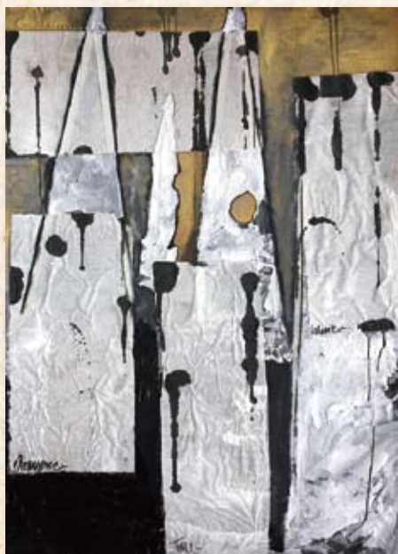
Nick Lee - Pyramid of Decay 2012