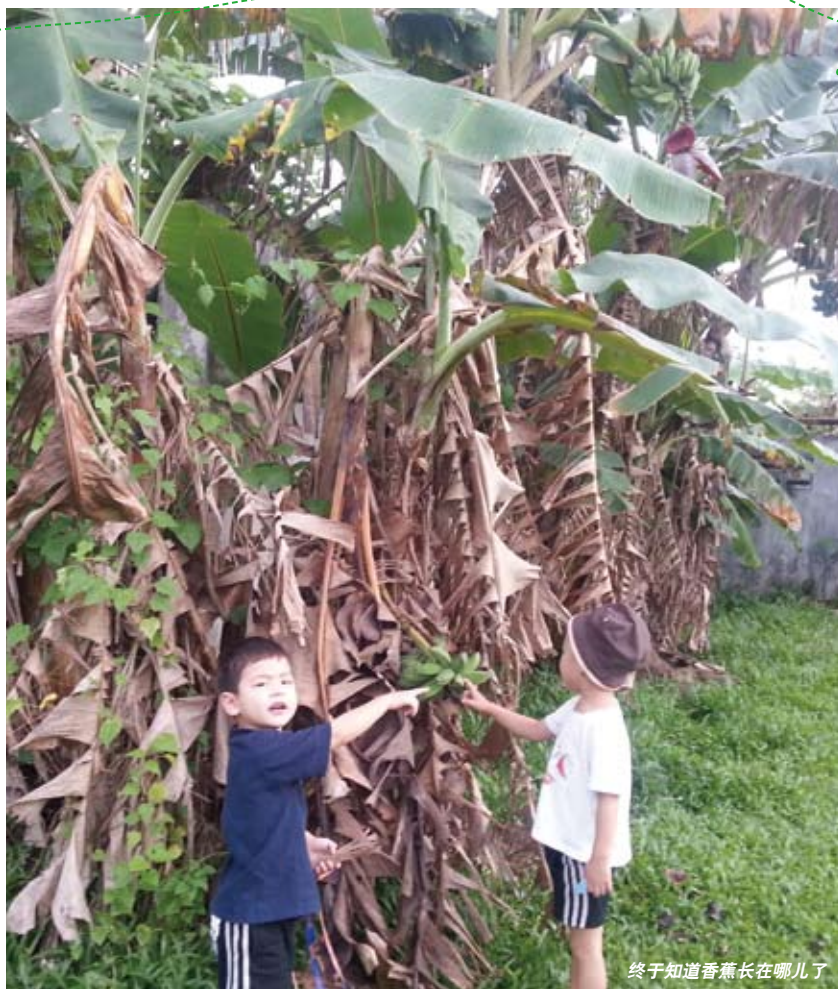
终于知道香蕉长在哪儿了