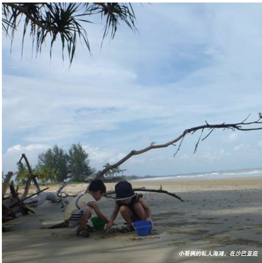
小哥俩的私人海滩，在沙巴亚庇