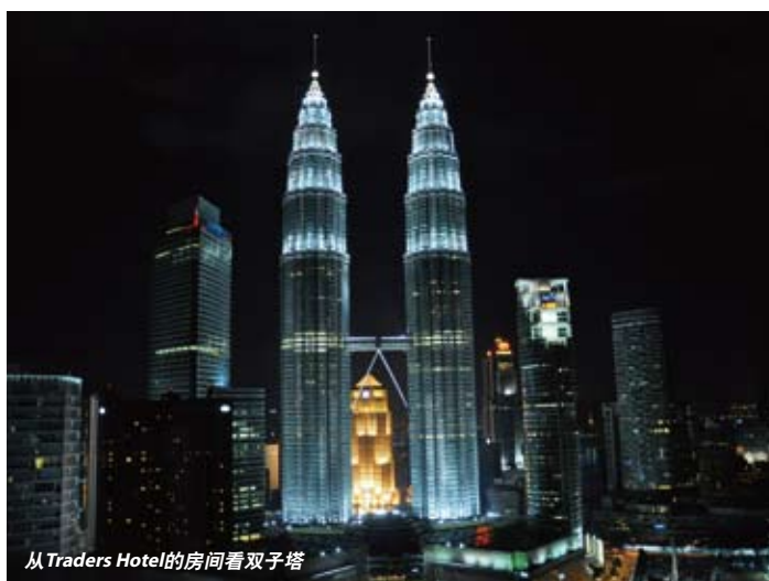
从Traders Hotel的房间看双子塔