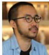
一清 青瓦花园老师。

对孩子来说，不受约束地自由玩耍是最好的状态。老师们相信，尝试比引导更重要，只有在自由状态下，探索的欲望才能完全被释放。探索的过程没有人期待结果，也无须评比优劣。