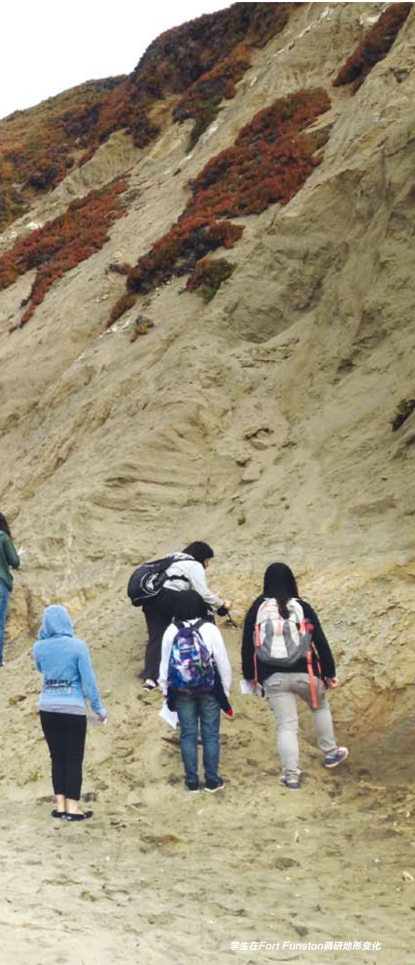
学生在Fort Funston调研地形变化