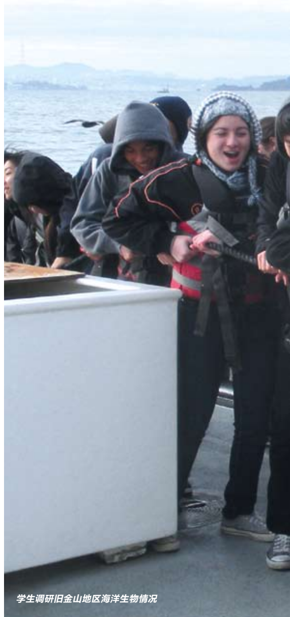
学生调研旧金山地区海洋生物情况